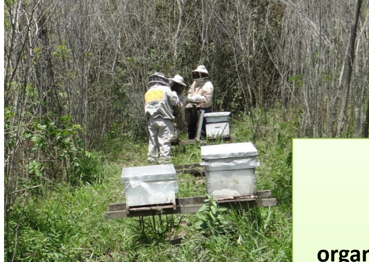
La apicultura practicada en Santa Cruz