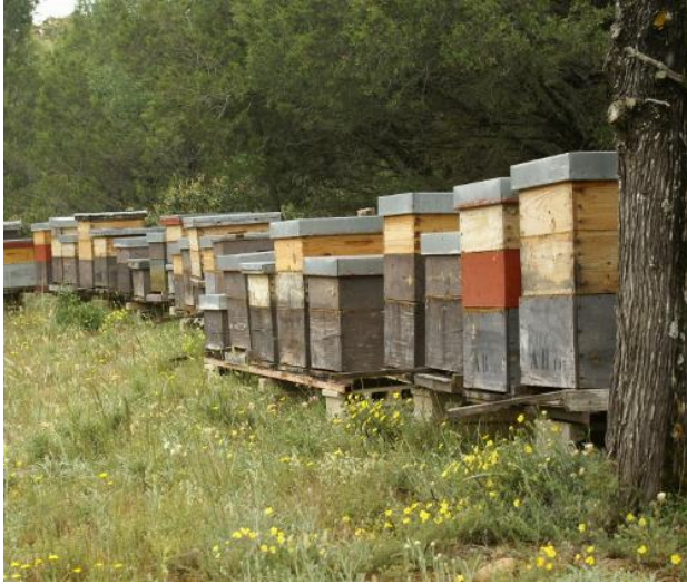
La apicultura practicada en Europa, EEUU, América