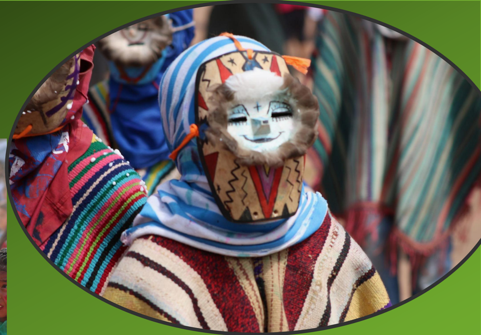
Arete Guazu en Itanambikua