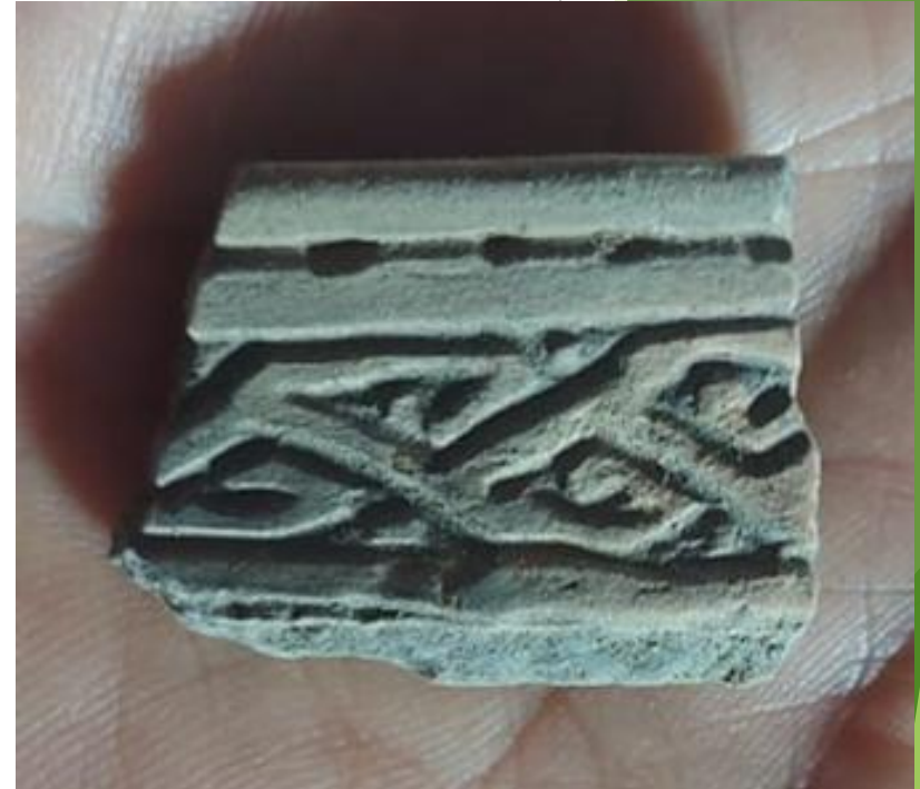
Restos de cerámica