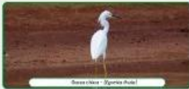
Garza blanca - (Egretta alba)