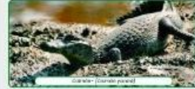
Crocodilo - (Crocodylus porosus)