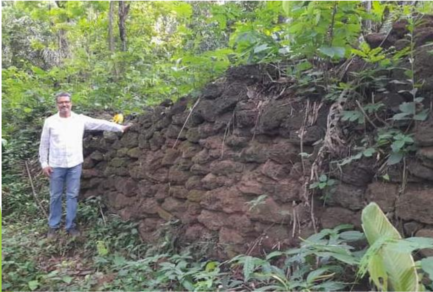
Ruinas de las Piedras en Gonzalo Moreno