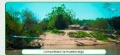
Comunidad La Chuelita Bajo