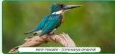
Morón pescador - (Ceryle alcyon amazona)