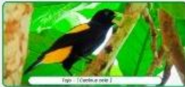
Tijero - (Ceryle alcyon)