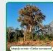
Maguejo común (Celtis americana)