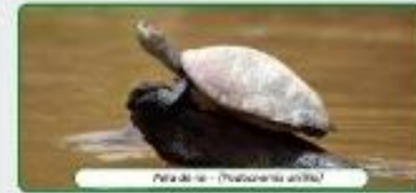
Pato de río - (Podiceps cornutus)

Porvenir es reconocido en el departamento de Pando, reconocido al haberlo sido durante 10 años el mejor destino turístico. Debido a su cercanía con la comunidad de Cachuelita Bajo, se puede disfrutar del patrimonio natural y cultural del municipio, obteniendo diferentes aspectos turísticos y recreativos de flora y fauna, variedad de aves, reptiles, peces, entre otros. Según el INEC (2017) existen 100 especies de peces en el río Tahuamanu y Pando es el mejor destino turístico de este departamento. Aprovechando la preparación del río, los usuarios, podrá en cualquier momento como disfrutar de diferentes tipos de recreación y actividades turísticas. El municipio de Porvenir está ubicado en el principal municipio de turismo de Pando, reconocido según el INEC (2017), dentro de los mejores del Dr. Sergio Garmezán B. y María Muñoz.